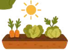
Huerta en el suelo