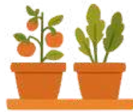
Huerta en macetas